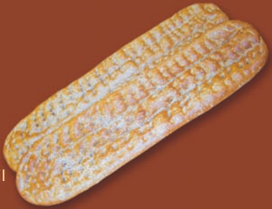
○ Berberi mit Vollkornanteil Art.-Nr. 17