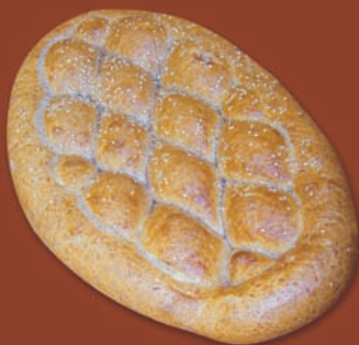
○ Fladenbrot mit Vollkornanteil Art.-Nr. 34