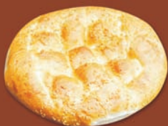
○ Fladenbrot klein Art.-Nr. 5