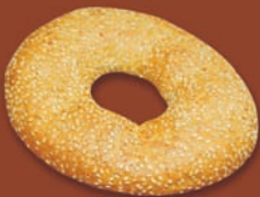
○ Simit Türkischer Sesamring Art.-Nr. 13