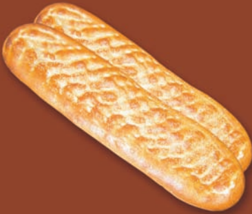
○ Berberi Art.-Nr. 12